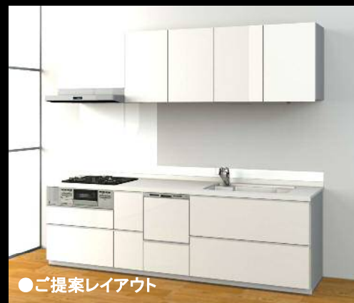
●ご提案レイアウト

すっきりとシンプルなフォルムに、日々のキッチンワークを楽しくするうれしい機能を盛り込みました。