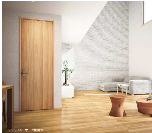
※シャイニーオーク使用例