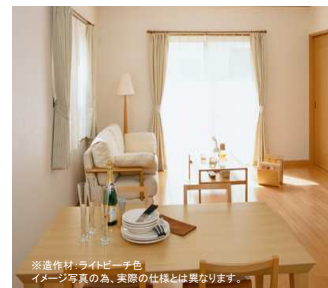
※造作材:ライトビーチ色 イメージ写真の為、実際の仕様とは異なります。