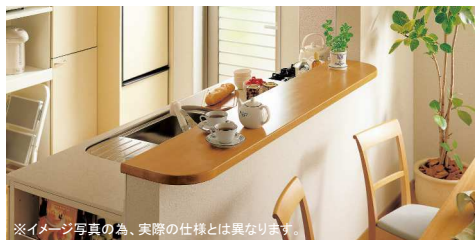
※イメージ写真の為、実際の仕様とは異なります。