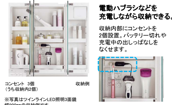
コンセント 3個 (うち収納内2個) ※写真はツインラインLED照明3面鏡 幅900mmの収納例です。