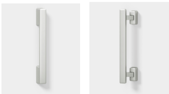
プラストシルバー