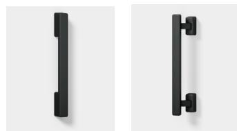
シルキーマットブラック